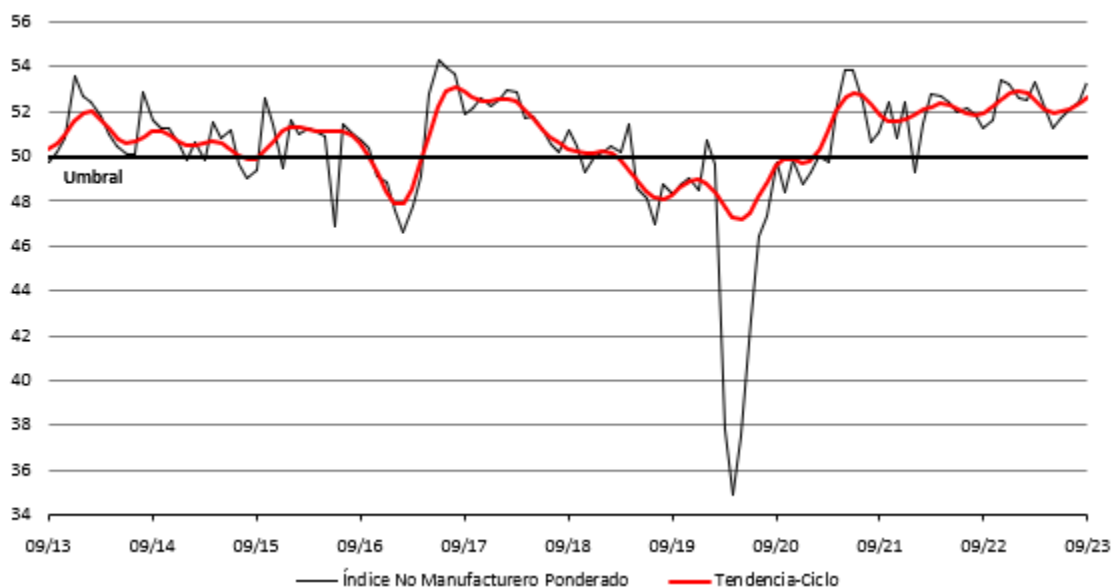
Cuadro 2: Indicador IMEF No Manufacturero y sus componentes