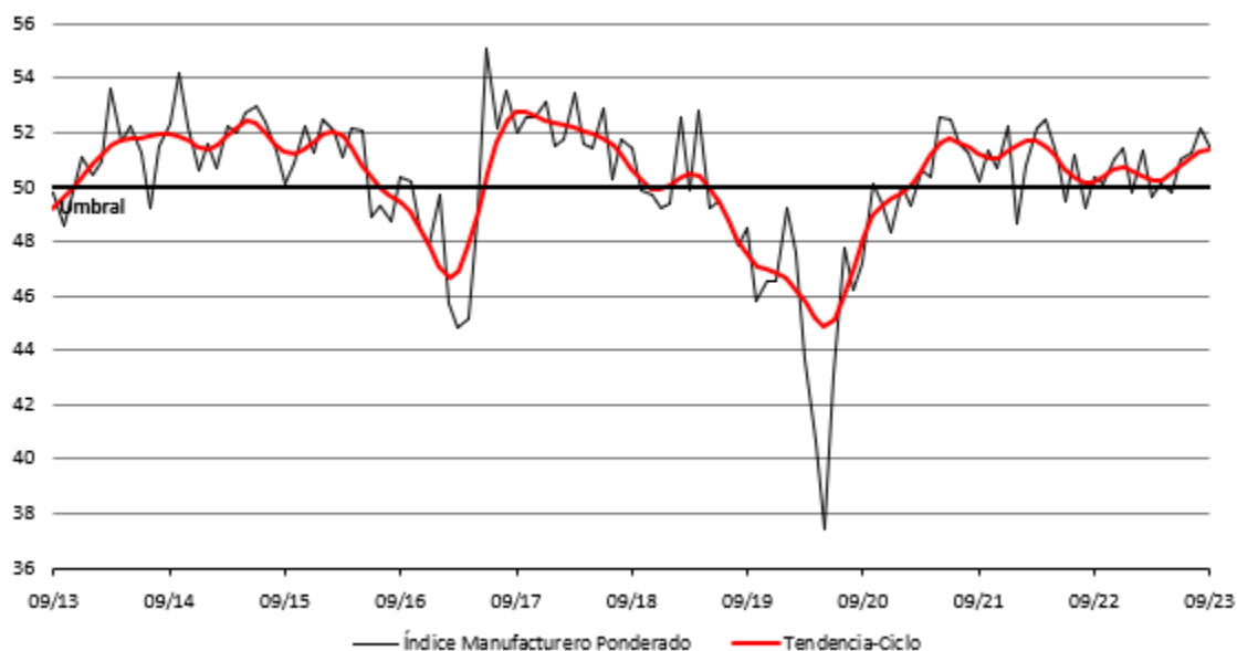
Cuadro 1: Indicador IMEF Manufacturero y sus componentes