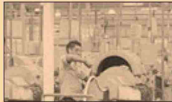
GRÁFICO EE: STAFF

De acuerdo con el IMEF, de persistir la debilidad del sector externo de la economía, el mercado interno comenzará a verse afectado.