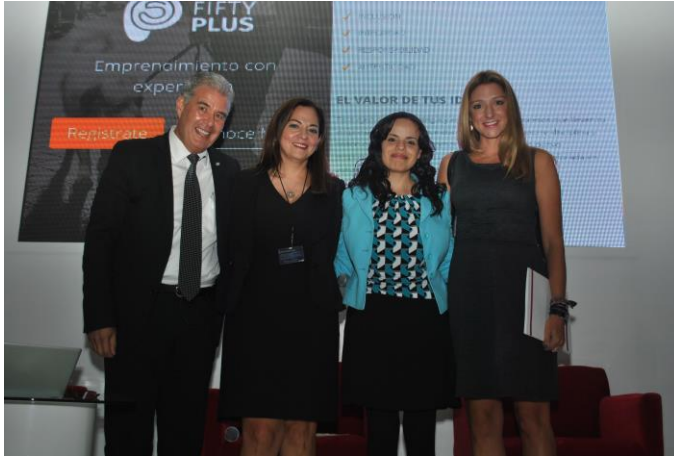
Al terminar el panel: Retos para el Desarrollo del Emprendimiento de Alto Impacto